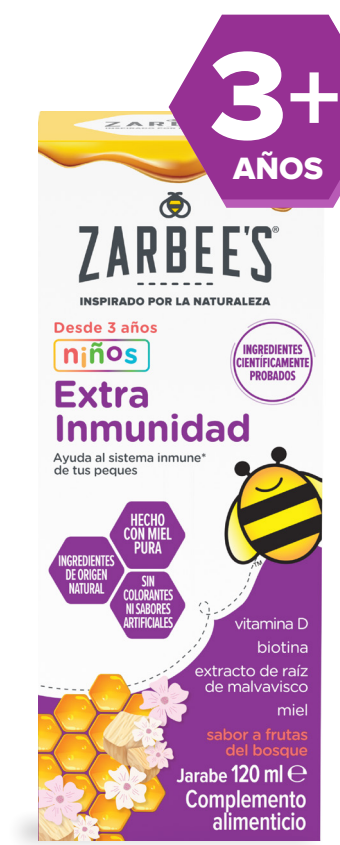
Niños 120 ml