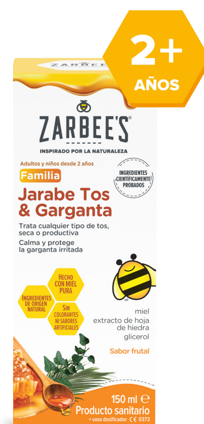
Familiar 150 ml

La forma dulce y eficaz de calmar la tos seca o productiva y de aliviar la irritación de garganta de toda la familia*