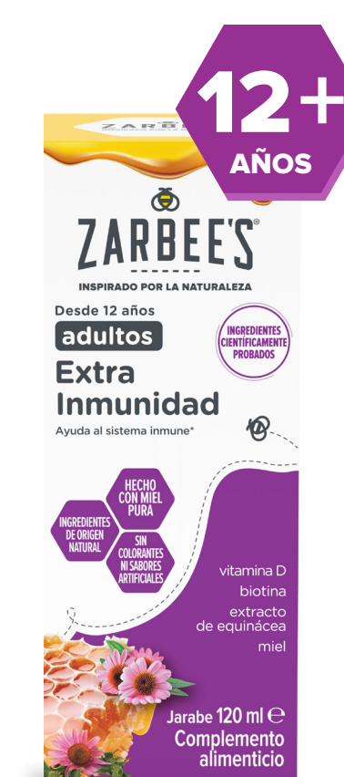
Adultos 120 ml