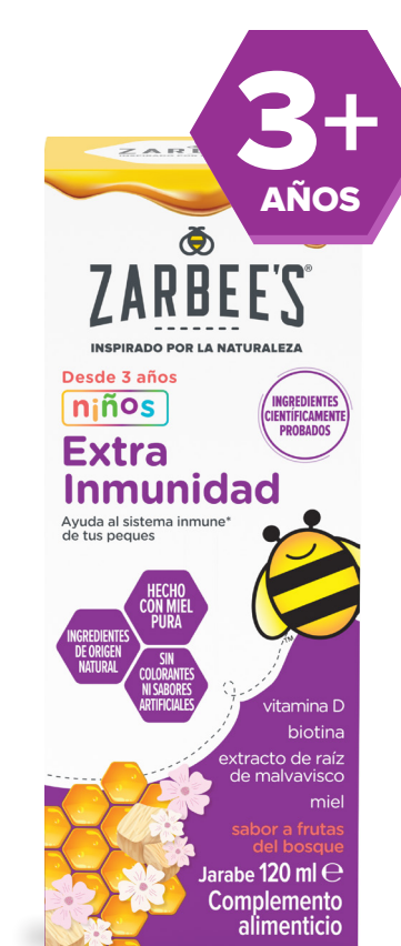
Niños 120 ml