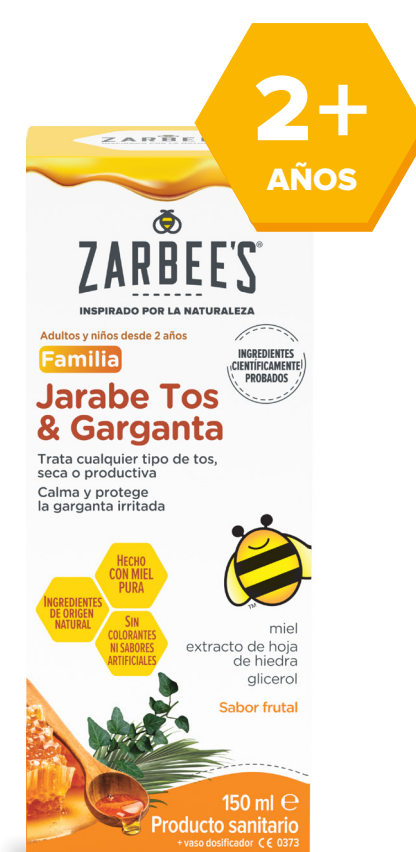
Familiar 150 ml

Proporciona alivio a sus pacientes y sus familias ante el primer signo de tos e irritación de garganta . 12